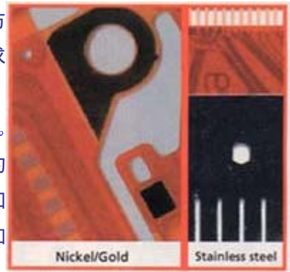
FIGURE 2: New OSP process on mixed metal PWB.

ENIG 也可以和新的 OSP 工艺一起设计是关键的话。这个高接合强度包装(area array package)的选应用中的导电性胶的更大的兼容性大都可以在最终表面处理之前浸或无电镀工艺将镀在不锈钢或